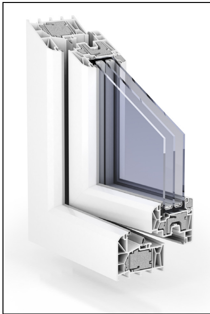
Trocal „88+“ Passivhaus-Fenster mit einem U_f -Wert von \leq 0,80 \text{ W}/(\text{m}^2\text{K}) .